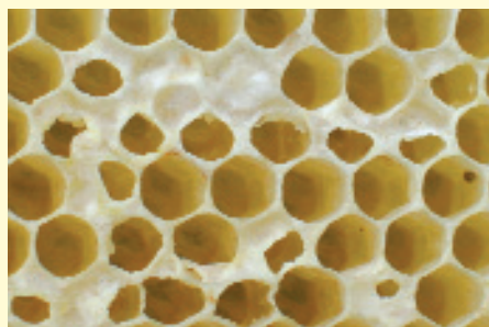
Abb.4: Ohne Abstand zum Brutnest oder auf schwache Völker aufgesetzt, werden Honigwaben häufig nicht vollständig gesäubert.

Nach der Spättrachternte je eine Zarge mit frisch ausgeschleuderten unbebrüteten hellen Honigwaben direkt über die Bruträume aufsetzen (Abb.1). Etwa drei Wochen später werden sie bei der routinemäßigen Wabenerneuerung