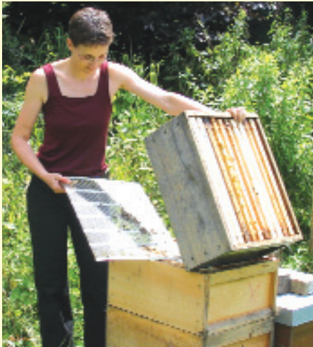
Abb.1: Direkt nach der Spättrachternte wird das Absperrgitter entnommen und einer der ausgeschleuderten Honigräume über die Bruträume platziert.