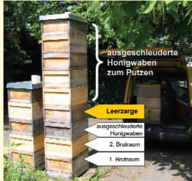
Abb. 2: Über einer Leerzarge auf starken Völkern platziert, werden ausgeschleuderte Honigwaben blitzschnell sauber und trocken. Achtung: wer nur 3 auszuschleckende Zargen über die Leerzarge aufsetzt, kann sie bereits nach wenigen Tagen wieder sauber abnehmen.

Mitte August zum zweiten Brutraum, ersetzen so eine Zarge mit alten, bebrüteten Waben.