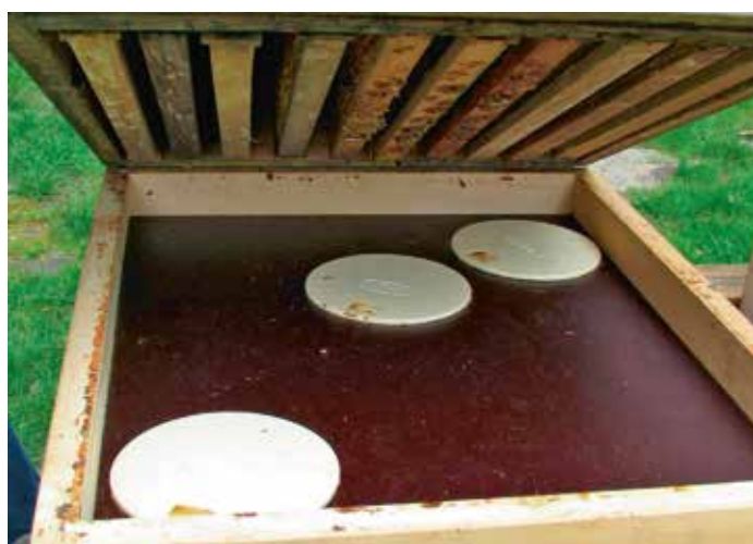
Die Bienen laufen durch ein Loch in Richtung Brutraum und schlüpfen auf der anderen Seite hinaus. Diese Bienenflucht funktioniert zufriedenstellend, wenn man mehr als ein Modell einbaut.

Einige Rezepte geben vor, dass der Imker über die Völkerführung Einfluss auf den Wassergehalt des Honigs nehmen kann. So sollen eng gehaltene Völker einen trockeneren Honig produzieren als weit gehaltene. Diese Behauptung klingt zwar logisch, doch hat sie sich bei mehrfacher Überprüfung kein einziges Mal bewahrheitet.