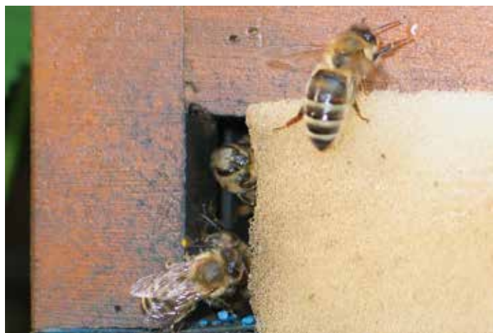
Fluglöcher von Jungvölkern klein halten.

Zwei Wochen später kann ohne große Störung des Jungvolkes zuverlässig beurteilt werden, ob „Alles in Ordnung“ ist. Nach einer weiteren Woche beginnen die Jungvölker zu wachsen, erst langsam und dann immer rascher. Ihre ungestörte Entwicklung wird durch eine ausreichende Futtersversorgung garantiert. Jedes Jungvolk wird mit einer Mittelwand erweitert und neben diese 1-3 mit je 1 Liter Zuckerwasser (3:2) oder Sirup gefüllte Tetrapack eingestellt. Schwimmhilfe nicht vergessen. Bei jedem Nachfüllen (alle 1-2 Wochen) wird eine weitere Mittelwand eingehängt.