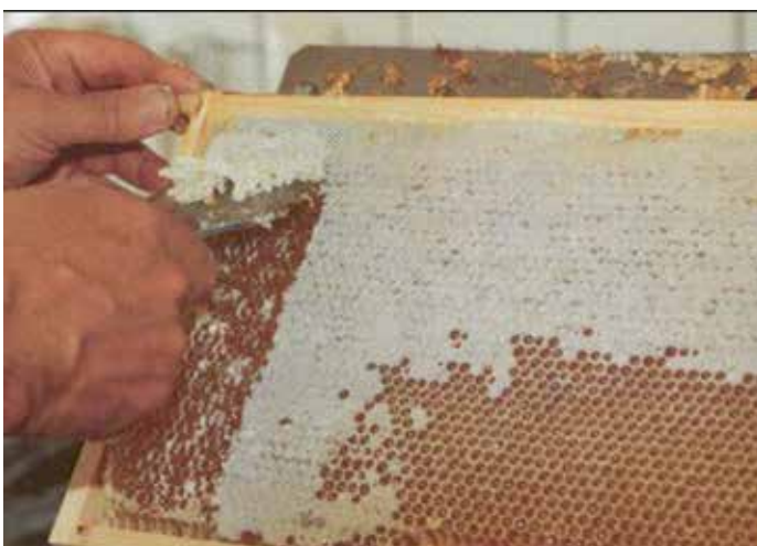
Entdeckeln mit Gabel.