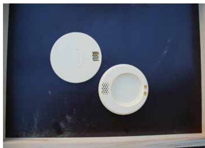
Das Modell von oben (links mit 1 Eingang) und von unten (rechts mit 2 Ausgängen)