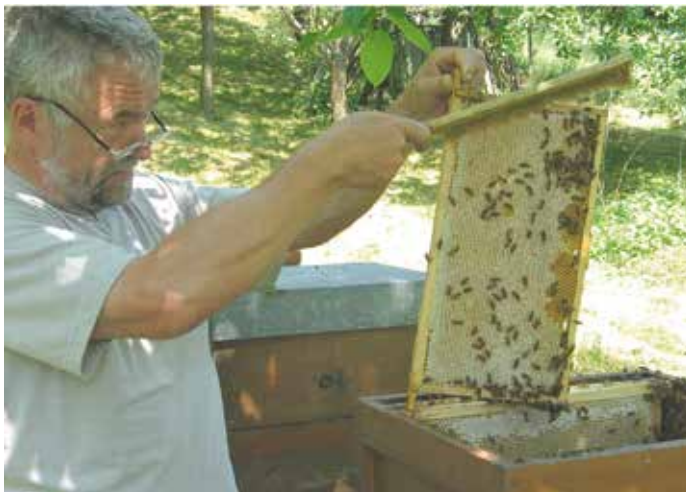
Honigernte mit Besen.

Redaktions- und Anzeigenschluss für die Juli-Ausgabe: ist Freitag, der 5. Juni!