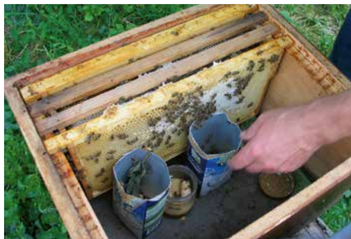
Fütterung mit Tetrapack und Honigglas.