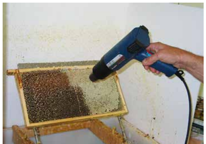
Entdeckeln mit Heißluft.