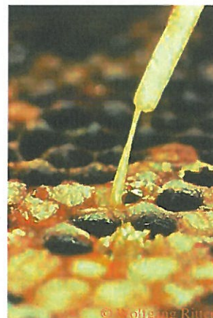
Abb. 2: „Streichholzprobe“